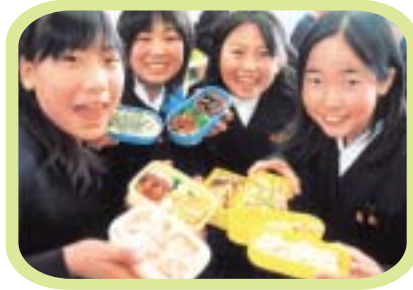
(地域に根ざした食育コンクールより)